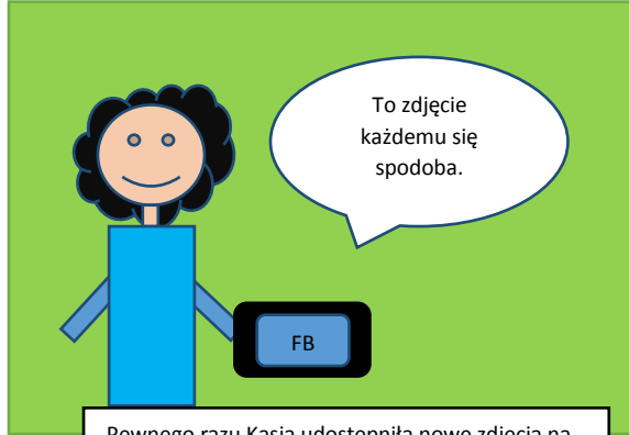
Pewnego razu Kasia udostępniła nowe zdjęcia na Facebooku.