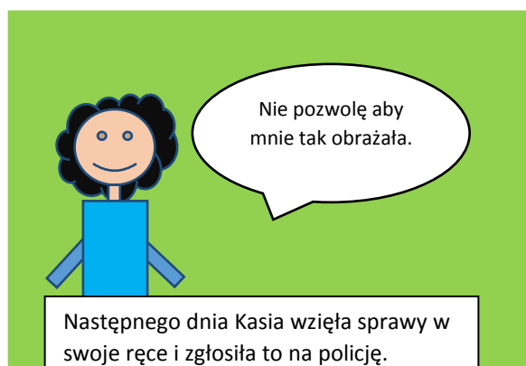
Następnego dnia Kasia wzięła sprawy w swoje ręce i zgłosiła to na policję.