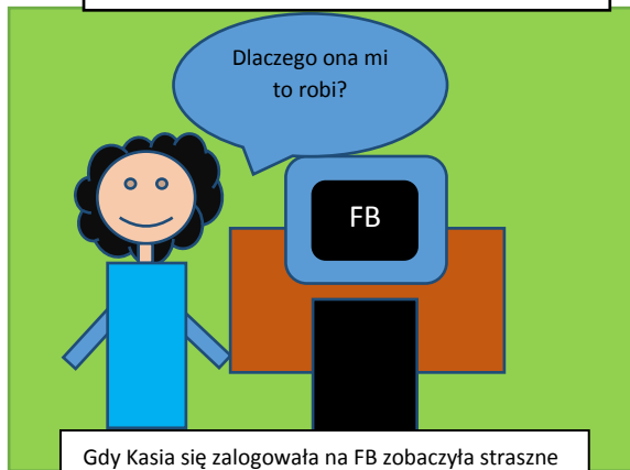
Gdy Kasia się zalogowała na FB zobaczyła straszne komentarze od Koleżanki.